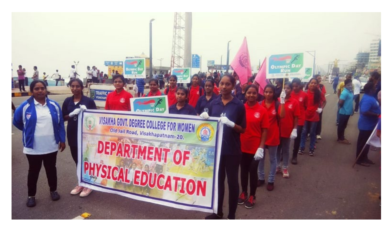
Health Awareness Progaramme(7-7-2018)